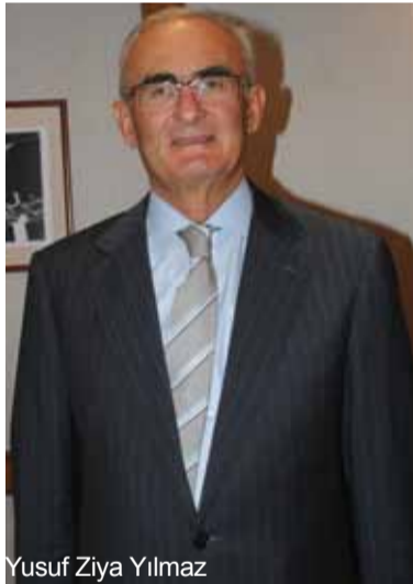
Yusuf Ziya Yılmaz

Samsun Belediye Başkanı Yusuf Ziya Yılmaz da, Gazetem'e Samsun-Krasnodar arasında direkt uçak seferleri veya gemi ulaşımı, Lojistik Köy oluşumu ve ticaretin arttırılması konu-