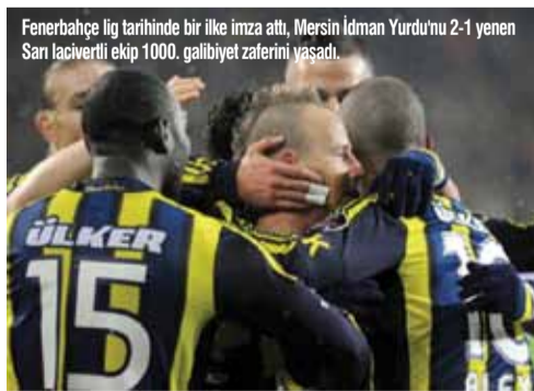
Fenerbahçe lig tarihinde bir ilke imza attı, Mersin İdman Yurdu'nu 2-1 yenen Sarı-lacivertli ekip 1000. galibiyet zaferini yaşadı.

Trabzonspor, deplasmanda Ankaragücü'nü 4-0 yenerken, 6 golle haftanın en çok gol atılan karşılaşması, olan Samsunspor-İstanbul Büyükşehir