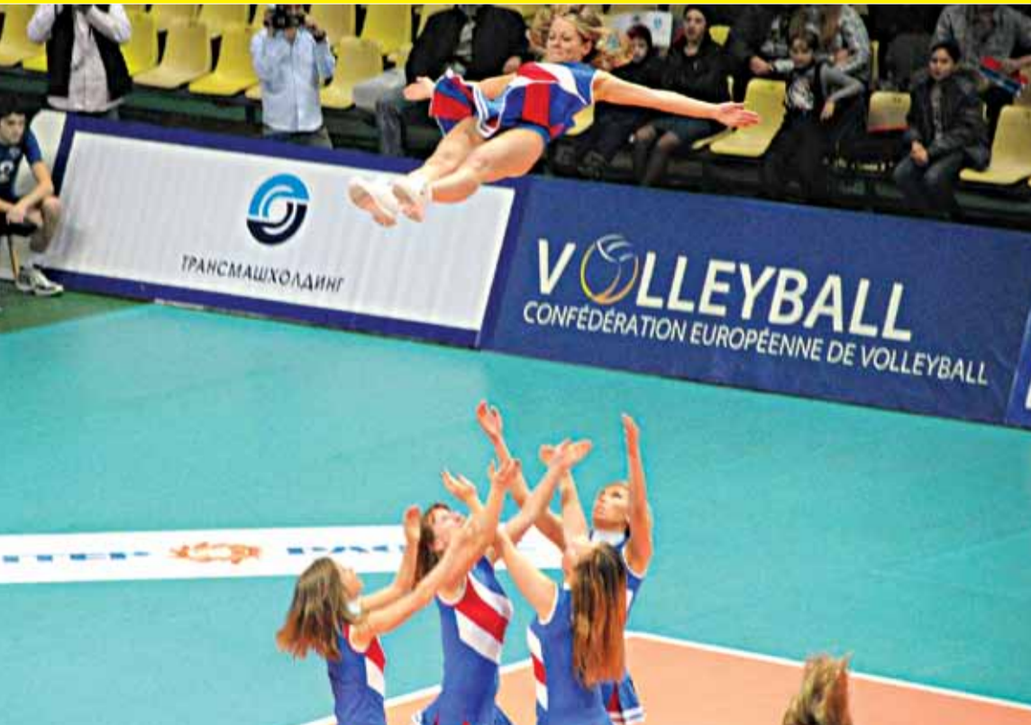
Dinamo Moskova - Halkbankası voleybol maçı set arası ponpon kızlarının gösterisi