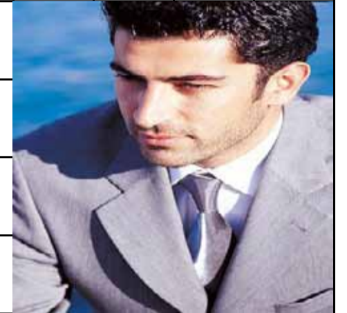
18.06.1974 Ankara doğumludur. 1997 yılında Best Model of Turkey'de birinci seçilmiştir. Best Model of The World'e katılmış, birinci olmuş ve ilk defa bir Türk Erkeği Best Model of The World olmuştur.