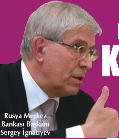
Rusya Merkez Bankası Başkanı Sergey İgnatyev