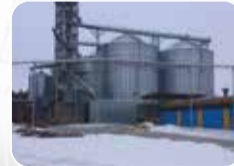
Anahtar Teslim İnşaat İşleri