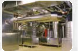
Havalandırma, Yangın ve Duman Sistemleri Üretim ve Satış