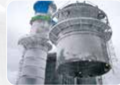
Teknolojik Makina&Ekipman Montajı