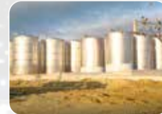
Paslanmaz Tank&Silo İmalat ve Montajı