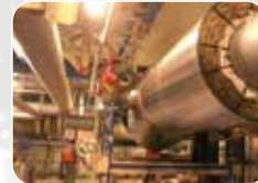
Ekipman ve Boru İzolasyonu