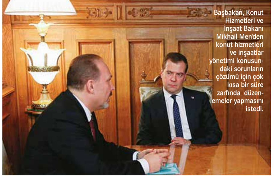
Başbakan, Konut Hizmetleri ve İnşaat Bakanı Mikhail Men'den konut hizmetleri ve inşaatlar yönetimi konusundaki sorunların çözümü için çok kısa bir süre zarfında düzenlemeler yapmasını istedi.

Başbakan, Men'den konut hizmetleri ve inşaatlar yönetimi konusundaki sorunların çözümü için