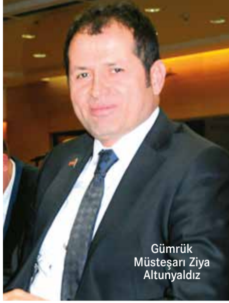
Gümrük Müsteşarı Ziya Altunyaldız

Tabi ki bunu arzu etmiyoruz. Ulusal sözleşmeler veya ülkelerin menfaatleri doğrultusunda biz de bu sorunun çözümlenmesini arzu ediyoruz. Biz de bu konuyu yakından izliyoruz.”