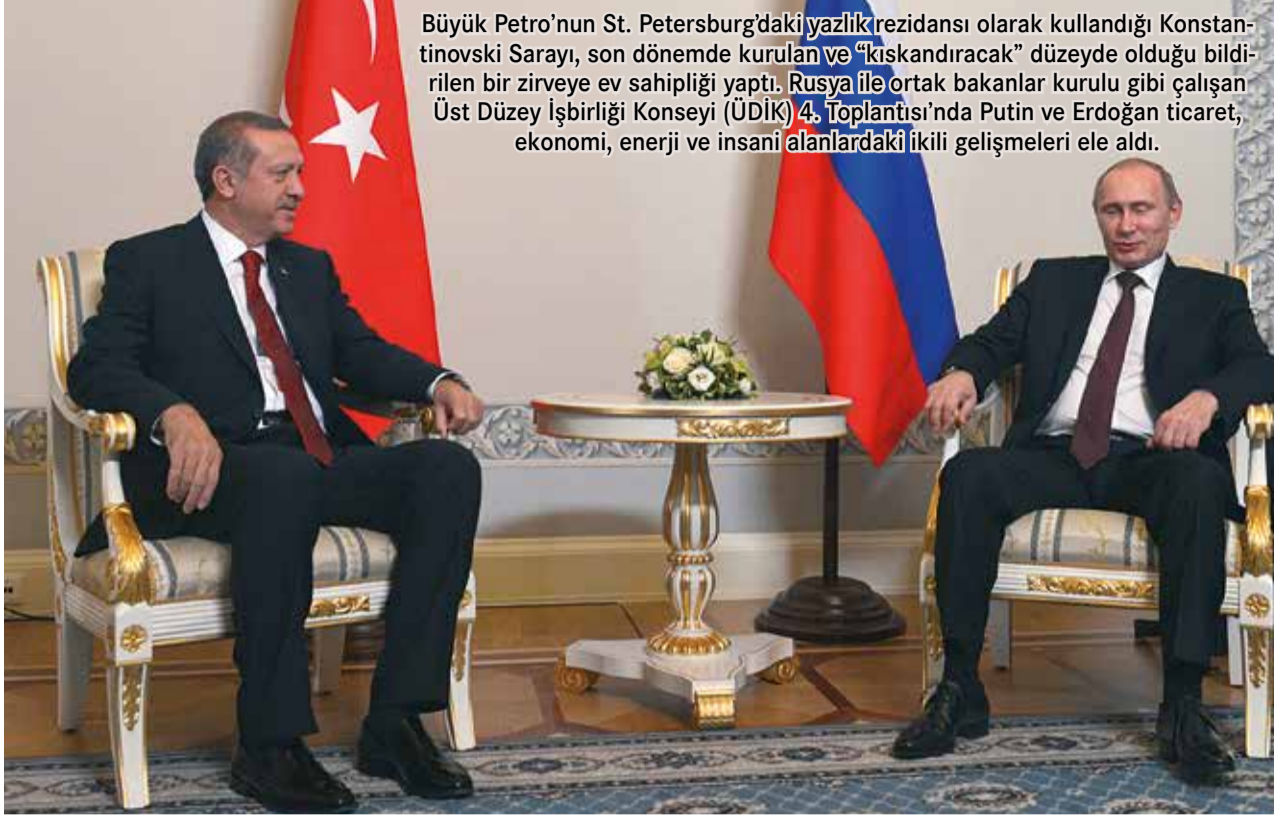
Büyük Petro'nun St. Petersburg'daki yazlık rezidansı olarak kullandığı Konstantinovski Sarayı, son dönemde kurulan ve "kışkandıracak" düzeyde olduğu bildirilen bir zirveye ev sahipliği yaptı. Rusya ile ortak bakanlar kurulu gibi çalışan Üst Düzey İşbirliği Konseyi (ÜDİK) 4. Toplantısı'nda Putin ve Erdoğan ticaret, ekonomi, enerji ve insani alanlardaki ikili gelişmeleri ele aldı.