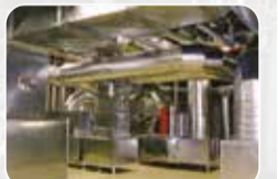
Havalandırma, Yangın ve Duman Sistemleri Üretim ve Satışı