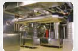
Havalandırma, Yangın ve Duman Sistemleri Üretim ve Satışı