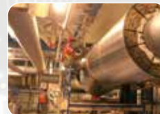
Ekipman ve Boru İzolasyonu