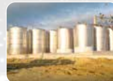
Paslanmaz Tank&Silo İmalat ve Montajı