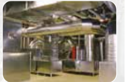
Havalandırma, Yangın ve Duman Sistemleri Üretim ve Satışı