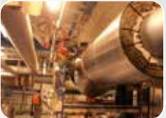
Ekipman ve Boru İzolasyonu