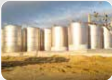
Paslanmaz Tank&amp;Silo İmalat ve Montajı