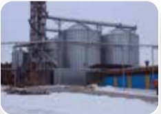
Anahtar Teslim İnşaat İşleri