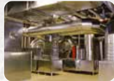
Havalandırma, Yangın ve Duman Sistemleri Üretim ve Satış