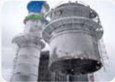
Teknolojik Makina&amp;Ekipman Montajı