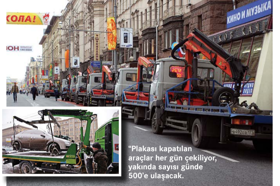
"Plakası kapatılan araçlar her gün çekiliyor, yakında sayısı günde 500'e ulaşacak."

Resmi Facebook sayfasında açıklamalarda bulunan Liksutov, "Plakası kapatılan araçlar her gün çekiliyor, yakında sayısı günde 500'e ulaşacak. Yaya yolları üzerine, otobüs duraklarına, kaldırımlara ve yayaların geçişlerine engelleyecek yerlere park edilen arabaları saymıyorum. Metroya bilet almak için kuyrukta bekleyen vatandaş sayısında da % 27 düşüş kaydedildi. Kuyruklar ciddi anlamda azaldı" ifadelerine yer verdi. Bilindiği gibi Moskova'da 2012 Kasım ayından itibaren ücretli otoparklar yapıldı. 2013'te proje Bulvarny Koltso, Sadoboye Koltso sınırları içerisinde yer almaya başladı. Bulvarny Koltso otopark ücreti 80 ruble, Sadoboye Koltso sınırları içerisinde ise 1 saatlik park ücreti 60 ruble oldu. Bölgede ikamet eden vatandaşlar ve engelliler akşam saat 20:00 ile sabah 08:00 arasında ücretsiz park edebiliyorlar.