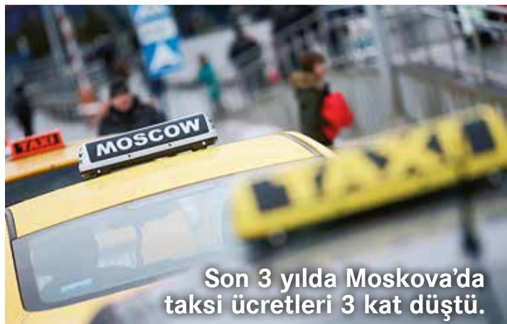
Son 3 yılda Moskova'da taksi ücretleri 3 kat düştü.

R US haber ajansı TASS'a konuşan Moskova Belediyesi Başkan Yardımcısı Maksim Liksutov, 2014 yılından bu yana taksi ücretlerinin yüzde 30 oranında düşüğünü açıkladı. Liksutov, "2014 yılına kıyasla taksi ücreti yüzde 30 düştü. 2016 yılında Moskova'da bir taksi yolculuğunun ortalama ücreti 500 ruble, 2015 yılında 650 ruble, 2014 yılında da 700 ruble seviyesindeydi" şeklinde konuştu. 2011 yılından bu yana Moskova Belediyesi 75 binden fazla