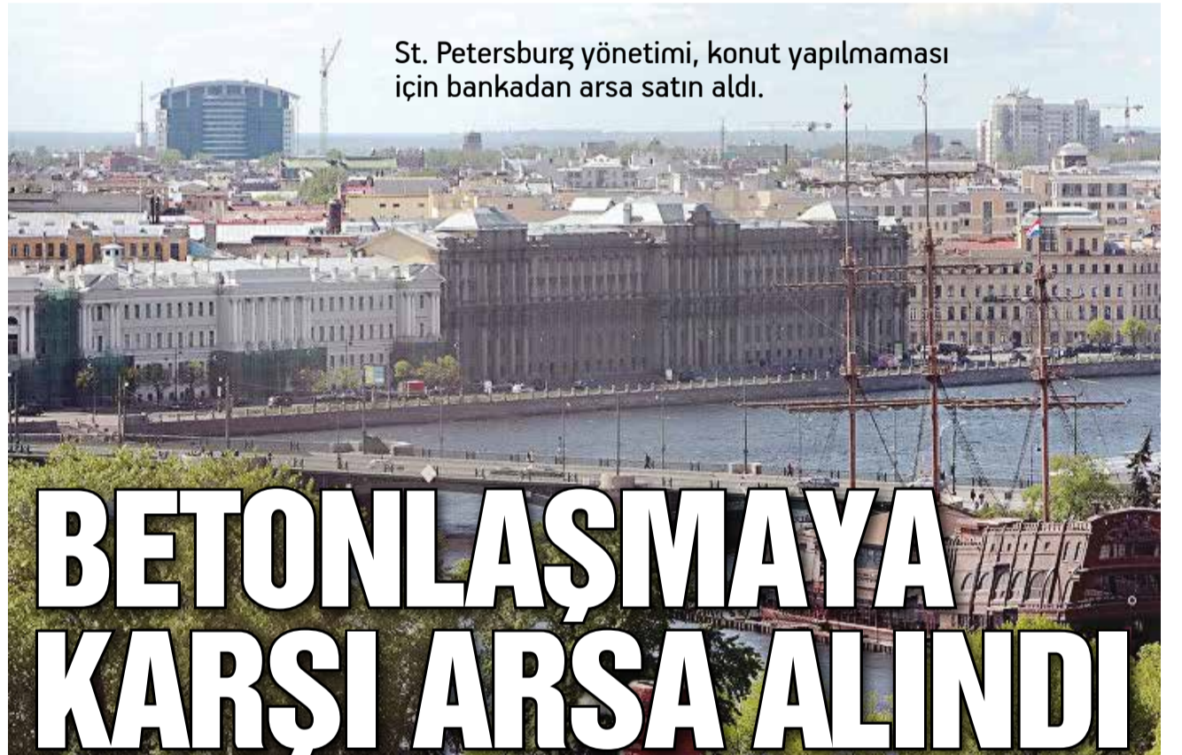
St. Petersburg yönetimi, konut yapılmaması için bankadan arsa satın aldı.