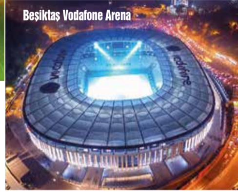
Beşiktaş Vodafone Arena

kadar devam edecek ve sonrasında en iyi beş stadyum açıklanacak. Aynı zamanda stat tanıtımlarının da yapıldığı açıklamalarda, statın kim tarafından kullanıldığı, ne kadara mal olduğu, hangi inşaat şirketi ve mühendislik ofisi tarafından dizayn yapıldığı da ayrıntılı olarak yer alıyor.