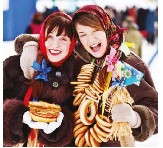
Baharın sembolü olan güneş şeklindeki yuvarlak krepler bayramın en popüler yiyeceği. Eskiden bayram haftasının her gününde farklı krepler yapılırdı.

Manejnaya meydanında bulunan ve buzdan yapılan ana Maslenitsa heykelinin uzunluğunun ise 8 metre olduğu bildirildi. Heykelin yapımı için Pervouralsk kentindeki göllerden getirilen 30 ton buz kullanıldı.