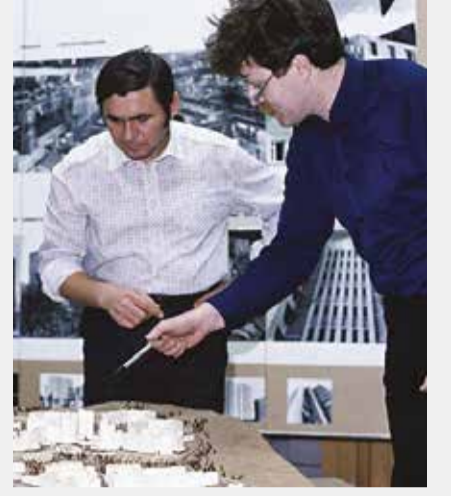
Yabancı mimarlar, Moskova'da premium yeni dairelerin yüzde 40'ının projesini hazırladılar.

"Yabancı mimarların neredeyse yarısı ihale düzenlenmeden özel piyasa araştırmaları, tavsiyeler ve önceki projelerdeki işbirliği sonucunda davet ediliyorlar. Şirket seçiminde en önemli rolü markanın bilinirliği oynuyor. Yabancı mimar seçiminde fiyat ve kalitenin birleşimi markanın bilinirliğinin gerisinde kalıyor."