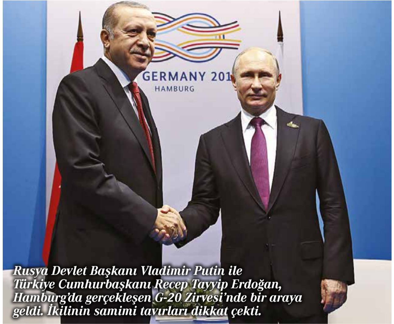
Rusya Devlet Başkanı Vladimir Putin ile Türkiye Cumhurbaşkanı Recep Tayyip Erdoğan, Hamburg'da gerçekleşen G-20 Zirvesi'nde bir araya geldi. İkilinin samimi tavırları dikkat çekti.