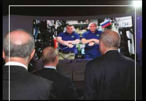
Türkiye Cumhurbaşkanı Recep Tayyip Erdoğan, Moskova'da düzenlenen MAKS-2019 Uluslararası Havacılık ve Uzay Fuarı'nda, Rusya Devlet Başkanı Vladimir Putin ile alanda yer alan standlarda astronotlarla canlı bağlantı gerçekleştirmişti.