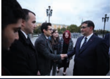
Enerji ve Tabii Kaynaklar Bakanı Fatih Dönmez, Uluslararası Rusya Enerji Haftası etkinlikleri kapsamında geldiği Moskova'da Nükleer alanında eğitim gören öğrencilerle bir araya geldi.