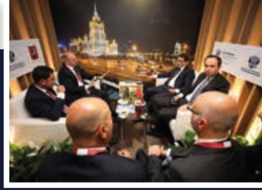
Enerji ve Tabii Kaynaklar Bakanı Fatih Dönmez (sağda), Azerbaycan Enerji Bakanı Parviz Shahbazov (solda) ile görüştü.