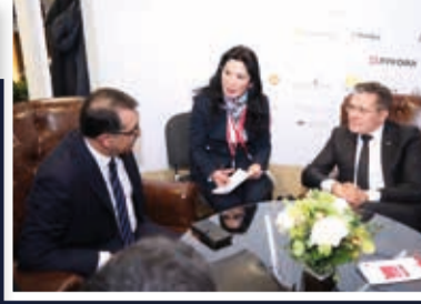
Enerji ve Tabii Kaynaklar Bakanı Fatih Dönmez, ROSATOM Genel Müdürü Alexey Likachev (sağda) ile görüştü.