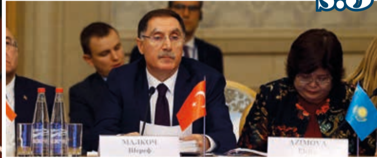
Kamu Başdenetçisi Şeref Malkoç, Moskova'da "3. Uluslararası Avrasya'da İnsan Haklarının Korunması Konferansı"nda konuştu.