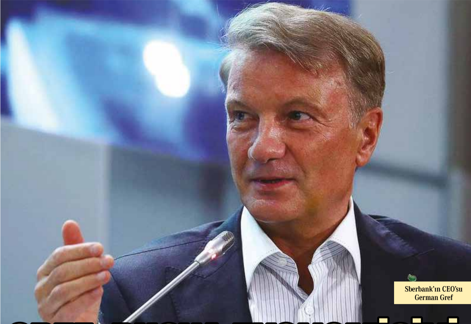
Sberbank'ın CEO'su German Gref