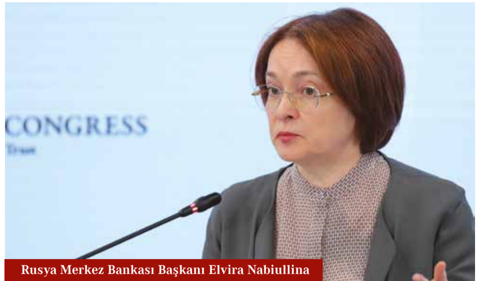
Rusya Merkez Bankası Başkanı Elvira Nabiullina

Rusya ekonomisinin yeniden yapılanmasının ise Merkez Bankası'nın beklemediğinden daha hızlı ilerlediğinin altını çizen Nabiullina, karamsar tahminlerinin gerçekleşmediğini belirterek, "Mali politikadaki esneklik, alınan çevik kararlar, mevcut durumdaki zorluklara adapte olabilen binlerce işletmemiz ve bu işletmeleri onlarla ortaklaşa çalışarak destekleyen hükümet sayesinde ekonomi beklemediğimizden çok daha iyi performans sergiledi" dedi.