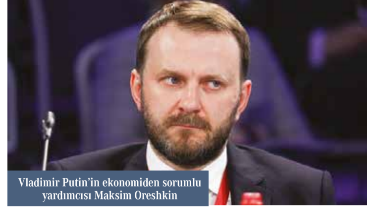
Vladimir Putin'in ekonomiden sorumlu yardımcısı Maksim Oreshkin

Rusya Devlet Başkanı Vladimir Putin'in ekonomiden sorumlu yardımcısı Maksim Oreshkin, Türkiye ile çok sayıda alanda önemli proje ve çalışmaların yürütüldüğünü belirterek, "Geleceğe dair çok iyi ve henüz gerçekleştirilmemiş büyük bir potansiyel var." dedi.